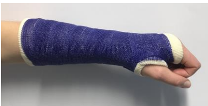
Buig uw vingers