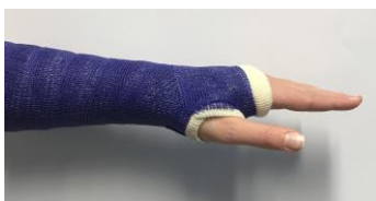
Strek uw vingers