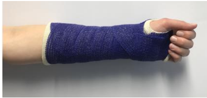
Strek uw elleboog