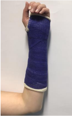
Buig uw elleboog