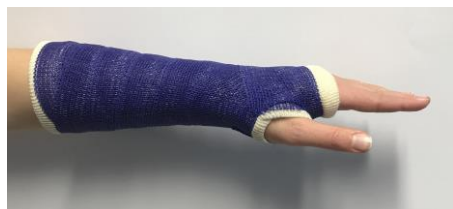
Strek uw vingers