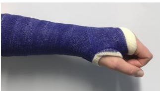
Buig uw vingers